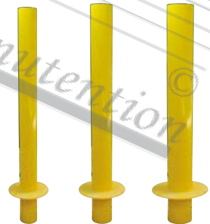
Q-10 2125 Q-10 2126 Q-10 2127

À colerette Fixation au sol par carottage ou manchon acier scellé.