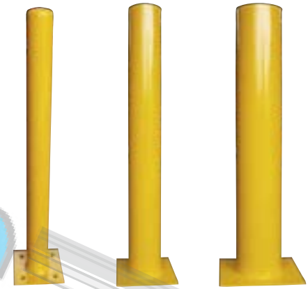
Q-10 2090 Q-10 2091 Q-10 2092