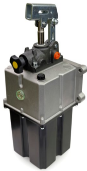
R10-9033 Pompe SE 45 cc 5L, 2 sorties 3/8