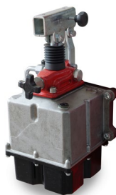
R10-9034 Pompe SE 25 cc 3L, 2 sorties 3/8