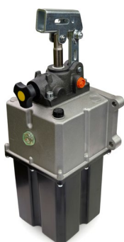
R10-9010 Pompe SE 25 cc 5L, 2 sorties 3/8