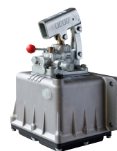
R10-9035 Pompe DE 25 cc 2L, 2 sorties 1/4