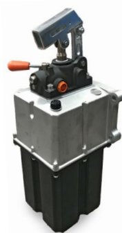
R10-9036 Pompe DE 45 cc 5L, 2 sorties 3/8