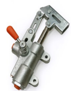
R10-9032 Pompe SE 20 cc, 1 sortie 1/2