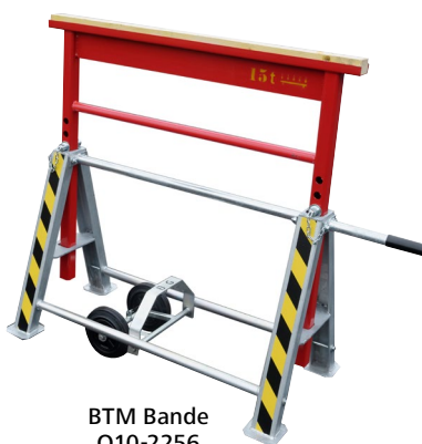
BTM Bande Q10-2256