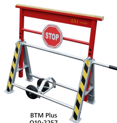
BTM Plus Q10-2257