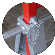
Réglage en hauteur avec blocage de sécurité des axes

Grâce à ses 5 positions de réglage, le tréteau se trouve toujours très proche de la sellette. La partie d'appui est revêtue d'un longeron en bois traité.