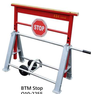
BTM Stop Q10-2255