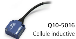
Q10-5016 Cellule inductive