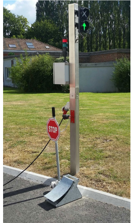
Colonne simple Q10-4033 accessoirisée