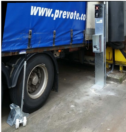
Poste de chargement avec colonne support