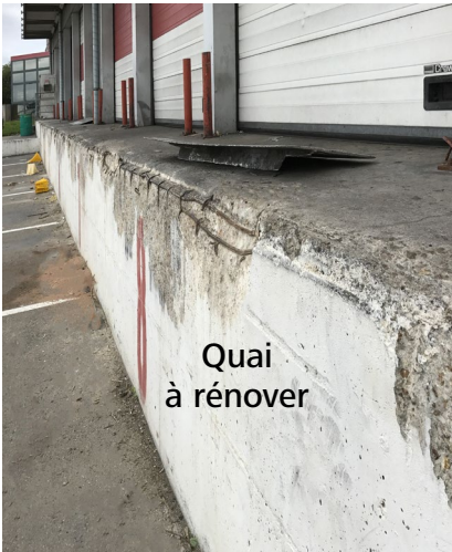
Quai à rénover

Pour une bonne installation et un bon usage sécurisé des matériels de transbordement, vos nez de quai doivent être sains avec cornières de rive acier ou renovés .