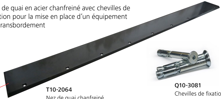
T10-2064 Nez de quai chanfreiné

Nez de quai en acier chanfreiné avec chevilles de fixation pour la mise en place d'un équipement de transbordement