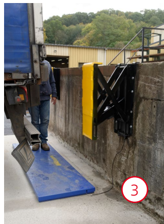
3 Sécurité active, extension instantanée du butoir