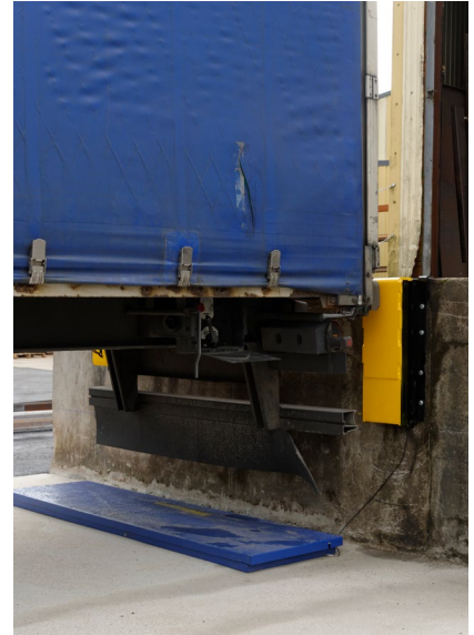
BRZ (550 x 220 x 140/500) en situation passive

ATTENTION, une aide technique ne remplace pas l'anticipation des chauffeurs