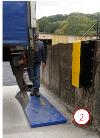
2 Sécurité active, le tapis détecte la présence d'une personne